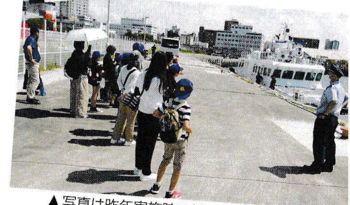
▲写真は昨年実施時の様子