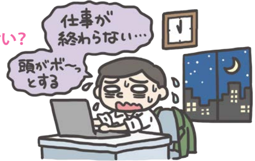
■ 過労死の労災認定基準～時間外労働の危険なライン～

恒常的な長時間労働によって「疲労の蓄積」が生じ、脳・心臓疾患を発症させる危険性があります。最悪、死に至る可能性もあります。働きすぎと思った場合には、労働組合や連合労働相談ダイヤル（0120-154-052）にご相談ください。また、働いた時間を手帳などにご自身で記録しておくことも大切です。